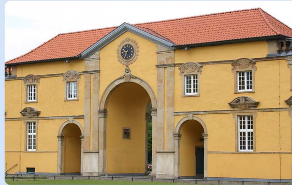
Osnabrücker Schloss Neuer Graben / Schloss 49074 Osnabrück